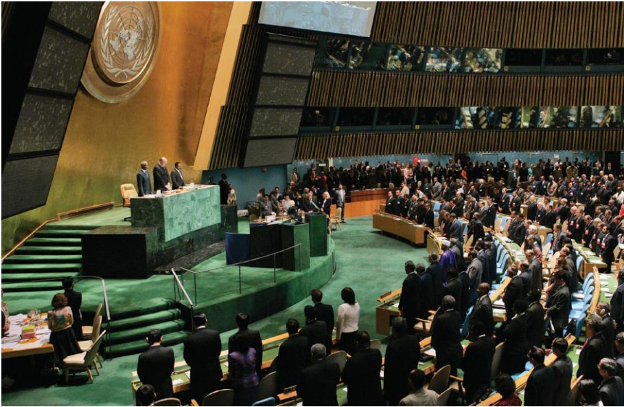
၂၀၀၅ ကမ္ဘာ့ထိပ်သီးညီလာခံကို ၂၀၀၅ စက်တင်ဘာ ၁၄ တွင် ဖွင့်လှစ်ခဲ့သည်