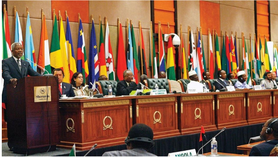
ဂမ်ဘီယာတွင် ကျင်းပသော AU ထိပ်သီးညီလာခံ

AU က စုပေါင်းတာဝန်ခံမှု အနေဖြင့် လူအများအား ကာကွယ်ရေးကို အာမခံခြင်းကို ဖွဲ့စည်းပုံ အက်ဥပဒေ၏ အောက်ပါ ပုဒ်များတွင် တွေ့နိုင်သည်။