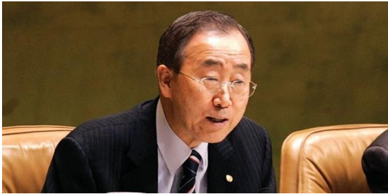
၂၀၀၉ ခုနှစ် အထွေထွေ ညီလာခံသို့ အတွင်းရေးမှူးချုပ်က RtoP အစီရင်ခံစာ မိတ်ဆက်ပေးသည်။